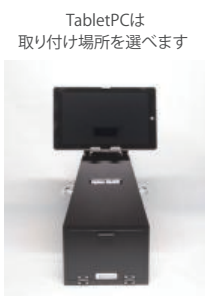
TabletPCは 取り付け場所を選べます

タブレット PC コントロール式 CMOS センサー撮影装置、 専用ソフトウェアで、3タッチで撮影・プリント完了！！