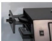
LED励起光源Blue Set +フィルタートレー標準搭載 多色蛍光撮影に対応